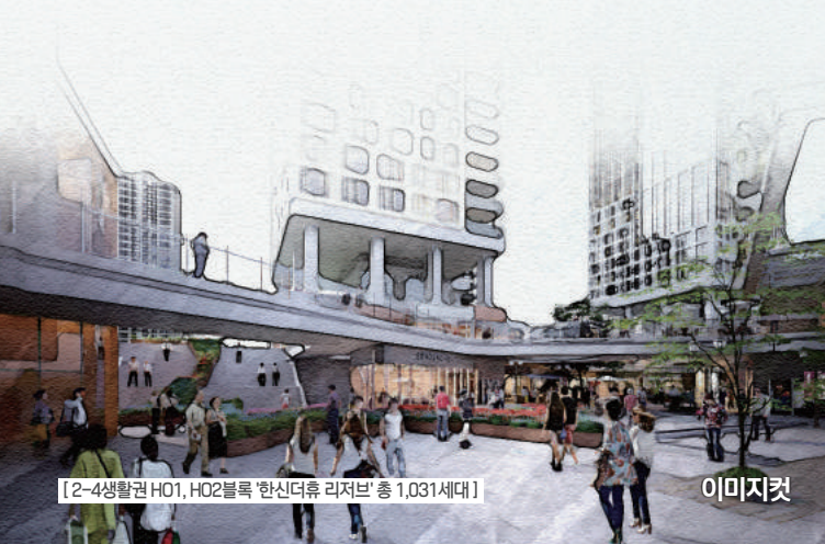
[2-4생활권 HO1, HO2블록 '한신더휴 리저브' 총 1,031세대]

이제, 한층 더 발전된 모습과 혁신적인 프리미엄으로 세종시에 새롭게 돌아옵니다.