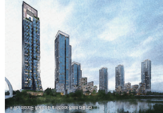
※ 상기 이미지는 설계공모한 투시도이며 실제와 다릅니다.

세종시 역사상 가장 高한 랜드마크 세종 2-4생활권 한신더휴 리저브 | 주상복합·상업시설 |