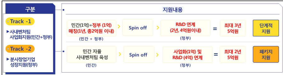
< 분사 전.후 단계별 지원내용 >

② 중소벤처기업부 창업사업화 지원사업 중 창업초기 지원사업의 수혜 이력이 있는 기업은 기 수혜 금액을 차감 후 지원 - 단, 민간투자주도형 기술창업프로그램(TIPS)에 기 선정된 창업기업은 지원 제외