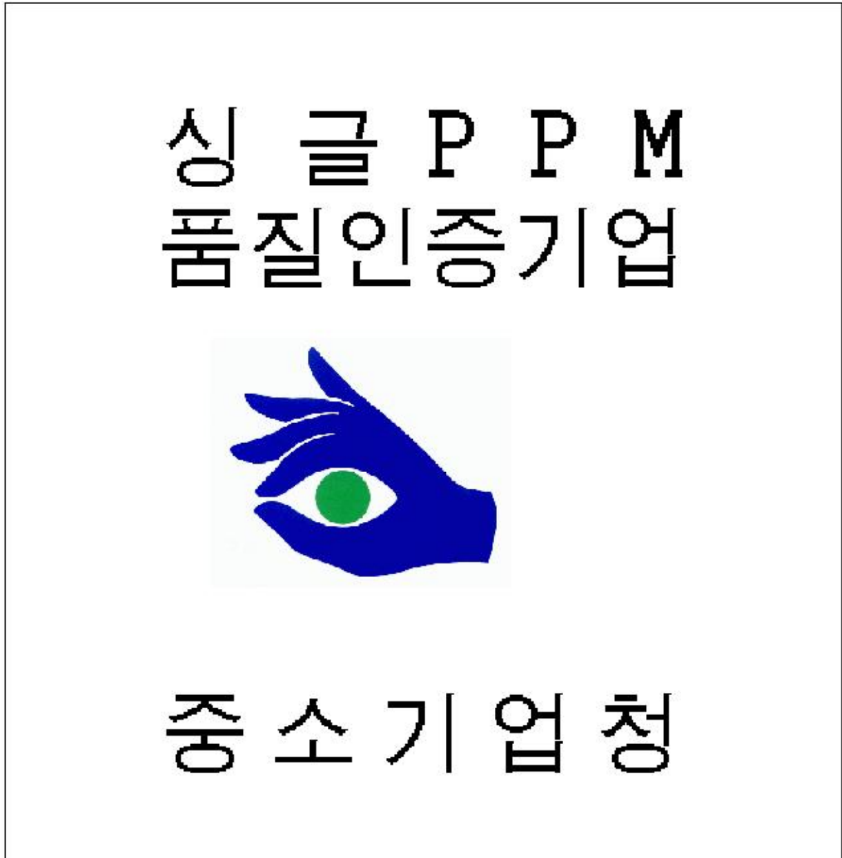
표 지 판 (제18조 제2항 관련)