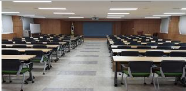
대전 한국철도공사 충남본부 인경실(5층)