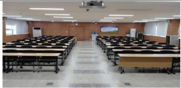
대전 한국철도공사 충남본부 인경실(5층)